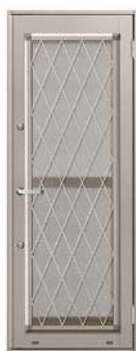
ヒンクロス格子 C型