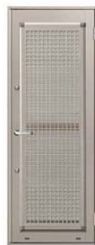
パンチングメタル E型