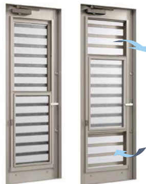
ダブルハング窓 全開時

● 効率的な採風・換気を実現 障子の上下を開けることにより、自然対流効果で、新鮮な空気を室内に、湿気や汚れた空気は室外へと、スムーズな換気ができます。