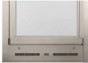
換気部品を開けた状態

ドア本体下柵部に換気部品を用意。室内側からつまみによって開閉できます。ドアを開けずに換気ができるので、外出時、就寝時などに便利です。